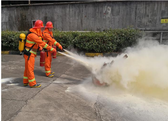
图 6.3-01 消防演练现场

案》等应急预案、《触电事件应急预案》、《重大设备故障应急预案》等应急处置方案等，对火灾、机械、触电等均有相应的应急措施，并成立了应急指挥中心和应急救援专业组。